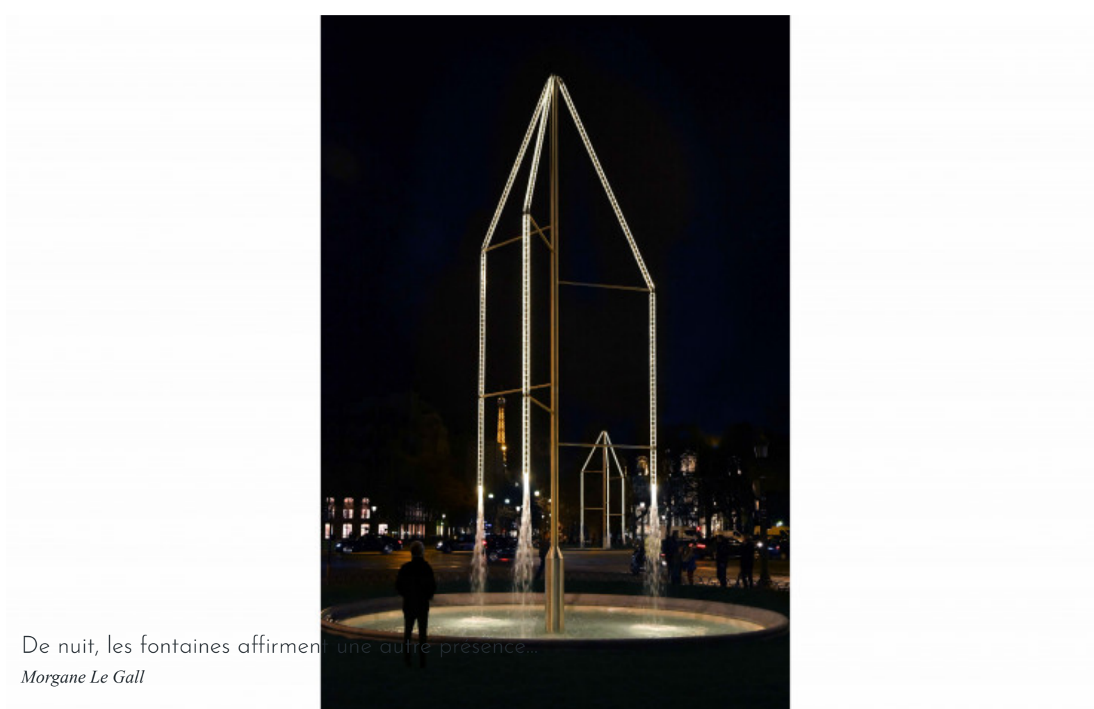
De nuit, les fontaines affirment leur présence... Morgane Le Gall

Le chantier, d'un coût total de 6,3 millions d'euros a été financé par le Fonds pour mécènes (Dassault, Swarovski, Galeries Lafayette, amis aussi le Qatar...) qui souhaitent soutenir des projets d'infrastructures culturelles et patrimoniales dans la capitale. Après s'être longtemps focalisé sur les seuls projets de design industriel, les Bouroullec semblent avoir jeté leur dévolu sur la ville depuis leur exposition à Rennes où ils formulaient des propositions pour l'espace urbain. Après des kiosques à Paris et Rennes et un aménagement paysager à Miami, ils signent un projet phare pour Paris.