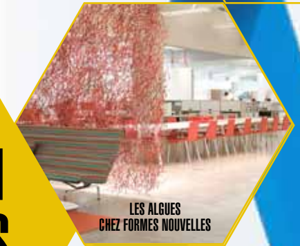
LES ALGUES CHEZ FORMES NOUVELLES