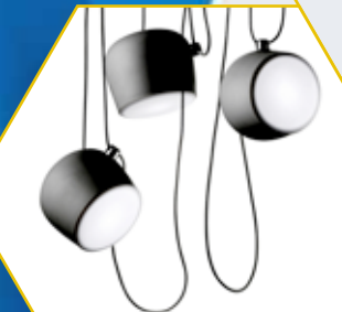
SUSPENSION FLOS CHEZ LIGNE ROSET