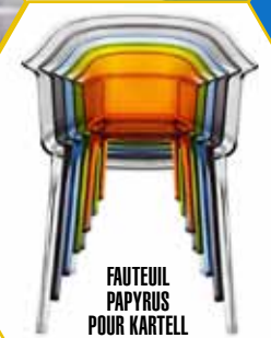
FAUTEUIL PAPYRUS POUR KARTELL CHEZ FORMA DESIGN