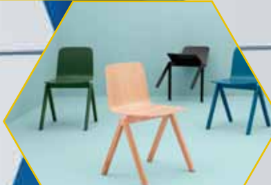
CHAISE COPENHAGUE CHEZ FORMA DESIGN