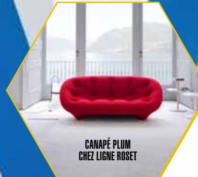
CANAPÉ PLUM CHEZ LIGNE ROSET