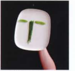
Ovale collection, 2010

Beneath a textile vault rising twelve meters high, the Bouroullecs present their light screens and filters created through the assembly of basic elements — Algues, North Tiles, Twigs, and Clouds —, which generate an abstract and surprising landscape.