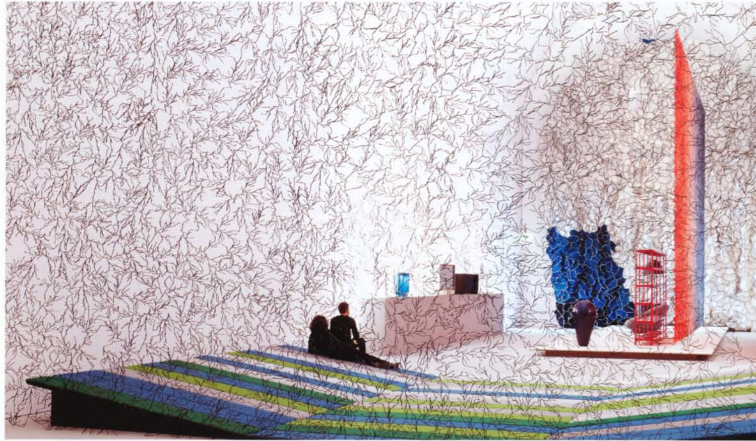
Algues, Momentané, 2013

'Momentané', Musée des Arts Décoratifs, Paris (France)