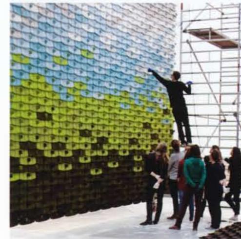
The North Tiles, Momentané, 2013