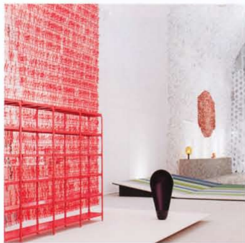
Twigs, Momentané, 2013