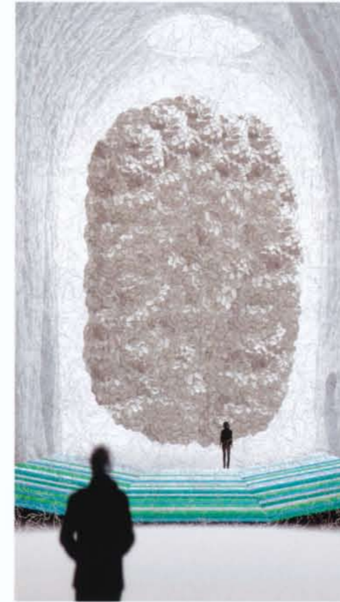
Clouds, Momentané, 2013