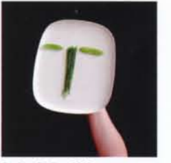
Ovale collection, 2010

Beneath a textile vault rising twelve meters high, the Bouroullecs present their light screens and filters created through the assembly of basic elements — Algues, North Tiles, Twigs, and Clouds —, which generate an abstract and surprising landscape.