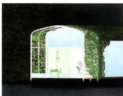
Dettaglio (a destra) con angolo-relax. Schema (sopra) del terrazzo rivestito di piante rampicanti. La casa galleggiante (in alto) scivola lenta sulla Senna.

all'esterno grandi portafiori con piante pronte ad arrampicarsi fino a invadere fronti e copertura. All'interno non vi è nulla di predefinito, a parte la zona dei servizi che posta al centro di questo suggestivo "tunnel" galleggiante sottolinea la separazione tra la zona notte e il living. Destinata a restare attraccata, anche se facilmente trasportabile, la "Maison Flottante" diventa una lanterna di notte, mentre di giorno si muove delicatamente sulla Senna. Con una navigazione così lenta da permettere che ogni cambiamento della luce riflessa sull'acqua pervada le superfici interne di legno e le pareti candide ritagliate dalle grandi vetrate. Sul lato lungo, infatti, due vaste finestre la proiettano verso il paesaggio francese. Creando una suggestiva atmosfera di contemplazione agli ispirati artisti destinati a viverla. ■