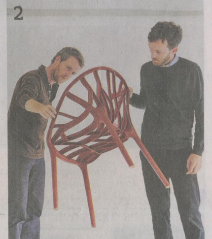
1. L'installation monumentale sous la nef des Arts décoratifs met en scène les systèmes de cloisonniers aux Bouroullec. 2. Les deux frères avec la chaise Vegetal. 3. L'alcôve Sofa, éditée par Vitra, en 2007. À mi-chemin entre le canapé et la cloison, elle permet de restructurer l'espace.

« Ronan et Erwan Bouroullec. Momentané » au Musée des arts décoratifs, Paris 1 er , jusqu'au 1 er septembre.