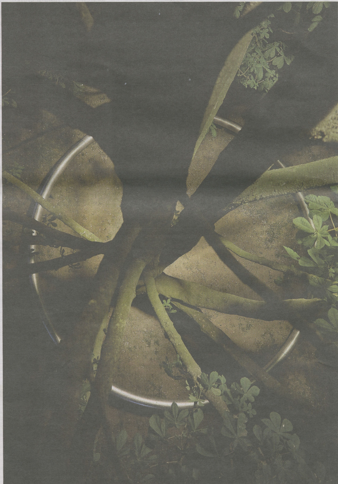
Et træ, en cirkelformet bæk, lys og skygge. Mere skal der ikke til for at sætte poesien i gang, når Bouroullec-brødrene er på spil.

Og lige præcis den slags design, som nærmest ophæver sig selv, er typisk for Bouroullec-brødrenes udformning af både rum og genstande. På designfirmaet Vitras grund i Schweiz vil der snart, udover cirkelformede bænke omkring kirsebærtræerne, også være et 100 meter langt springvand, der som en diskret rende forløber hen over arealet. Inspirationen kommer blandt andet fra Ronans datter, som elsker at sætte brugte metrobilletter i fart på Paris' dybe rendestene som små skibe. I Miami afsløres Bouroullec-brødrenes nye byrum i september, og i Paris er de ved at designe et nyt, stort springvand på Avenue des Champs-Élysées. Bouroullec-brødrene blev hentet til Aarhus Kunsthall for