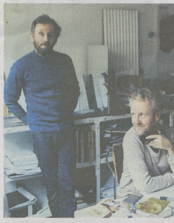
I værkstedet i Paris. »De ting, man skaber som designer, bliver en del af verden.«

»I 1990'erne var det Cappellini i Italien. Jeg var utrolig ung, da jeg begyndte at arbejde for Cappellini, og jeg følte mig som en ung fodboldspiller, som var blevet købt af det store hold. De gamle designfirmaer har en stor skat af ældre design, og jeg er ikke sikker på, at alle firmaer overhovedet bør få lavet nyt design. Måske skal de bare producere de skatte, de allerede har. Men når jeg arbejder for designfirmaer som Artek eller Kvadrat eller Vitra i de forskellige lande, føler jeg mig som en skuespiller. Jeg spiller min rolle. Hvis jeg arbejder for finske Artek, så prøver jeg at være finsk, hvis der er brug for det. Ligesom skuespilleren skal jeg kunne være utroligt sjov eller rørende, men jeg er der for at give den rigtige optræden i konteksten, det rigtige svar på opgaven, præcis som når en arkitekt bygger et hus midt i et landskab, så det passer ind. Jeg skal være bevidst om hele denne mægtige tradition, firmaet viderefører, men vi lever i en anden tid, konteksten er en anden, og vi skal skabe noget, som duer i dag. I sidste ende er spørgsmålene altid: Er det smukt? Er det produceret under ordentlige forhold? Giver det mening? Vi afviser 90 procent af de firmaer, som gerne vil arbejde sammen med os, fordi vi bare ikke kan se en grund til at lave lige den ting. Der skal være en grund, og bare at tjene penge er aldrig den grund.«