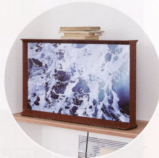
01 삼성전자와 부홀렉 형제가 함께 개발하고 디자인한 세리프 TV.

제안한다는 점을 선정 이유로 밝혔다. 세리프 TV는 가전제품이 사용자의 라이프스타일을 위한 디자인 오브제로도 제대로 진화했음을 보여주고 있다. 글: 오상희 기자 관련 기사: 2016년 1월호 'TV보다는 가구라는 말이 더 어울리는 삼성 세리프 TV' 52쪽