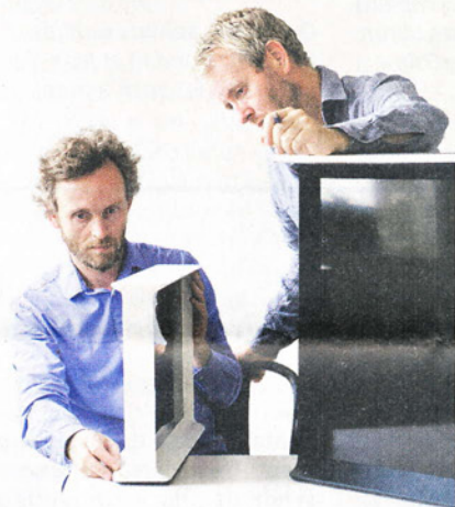
Erwan et Ronan Bouroullec devant leur télévision Serif pour Samsung.

À quoi ça sert, le design ? S'il fallait trouver une réponse, les designers Ronan et Erwan Bouroullec la donnent avec brio à Rennes, où sont inaugurées, jeudi 24 mars, quatre expositions qui leur sont consacrées aux Champs libres, au Fonds régional d'art contemporain (FRAC) et au Parlement de Bretagne. En jouant « à domicile », ces natifs de Quimper n'ont pas seulement choisi de montrer l'étendue de leur talent – déjà reconnu internationalement – dans la création d'objets du quotidien depuis la fin des années 1990. Ces quadragénaires bardés de récompenses font aussi des propositions inattendues pour habiter la ville autrement (à la façon du maestro italien Andrea Branzi), ce qui sonne comme un tournant majeur dans leur carrière.