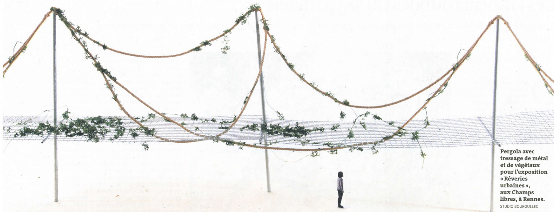
Pergola avec tressage de métal et de végétaux pour l'exposition « Réveries urbaines », aux Champs libres, à Rennes. STUDIO BOUROULLEC