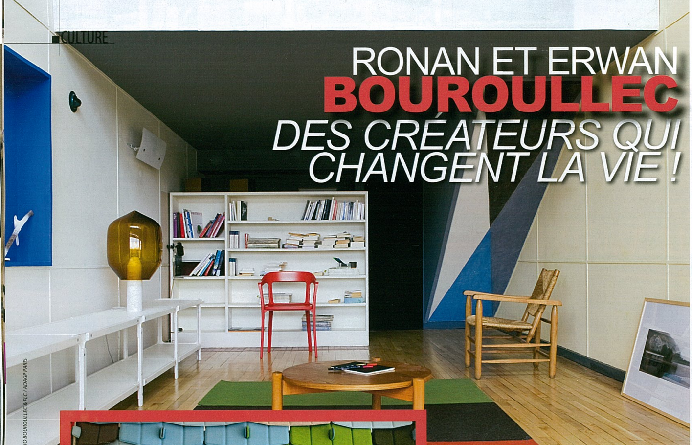
STUDIO BOUROULLEC & FLC / ADAGP PARIS