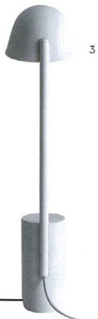
3. Lampada Ronan & Erwan Bouroullec BITOSSÌ