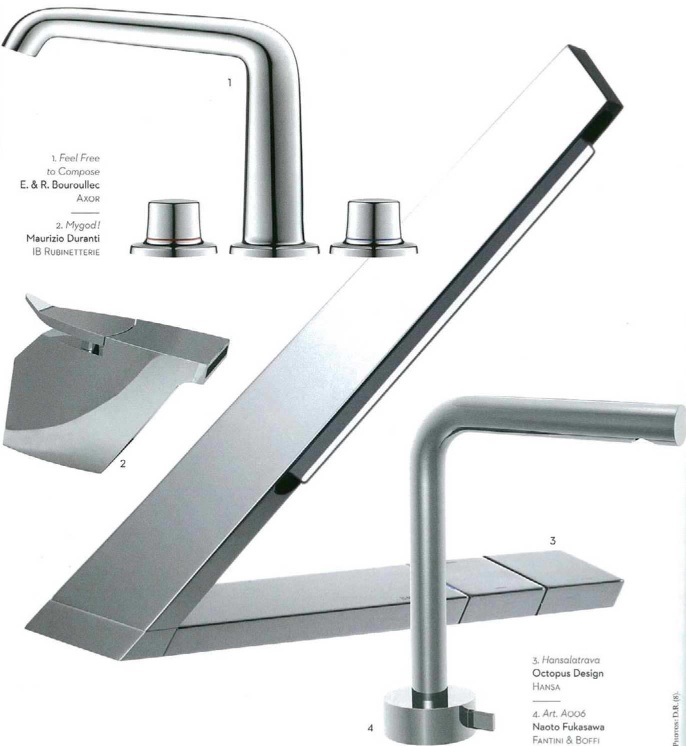
1. Feel Free to Compose E. & R. Bouroullec AXOR 2. Mygod! Maurizio Duranti IB RUBINETTERIE