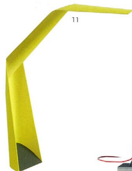
11. Paper Task Claesson Koivisto Rune WÄSTBERG