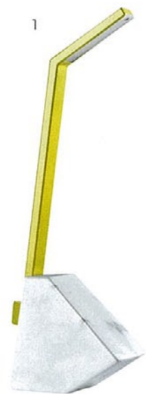
1. Swing Zaven