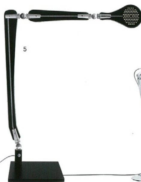
5. Ina Carlotta de Bevilacqua DANESE