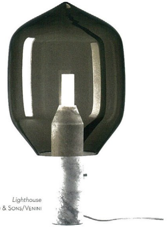
Lighthouse ESTABLISHED & SONS/VENINI