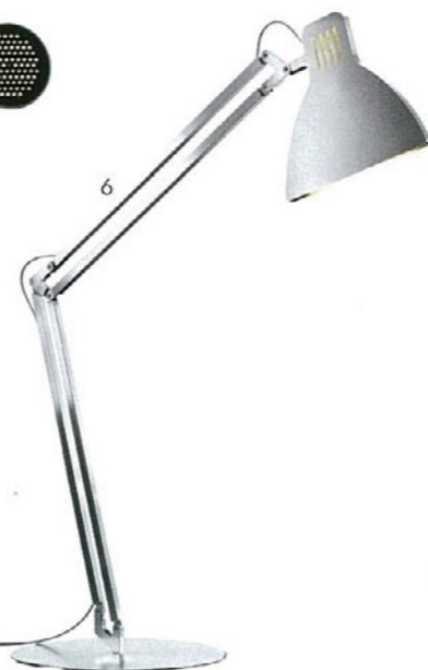
6. Looksoflat Stefan Geisbauer INGO MAURER