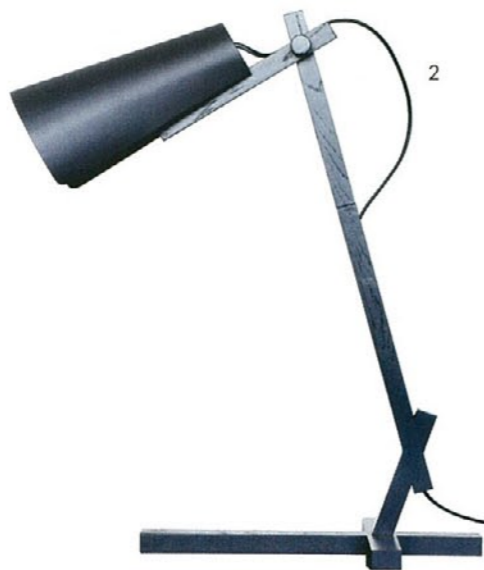
2. Tys CHRISTOPHE DELCOURT