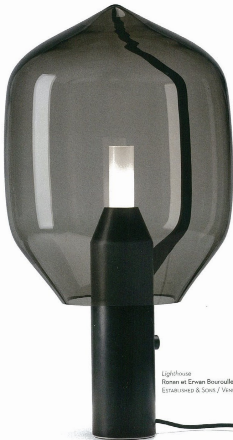
Lighthouse Ronan et Erwan Bouroullec ESTABLISHED & SONS / VENINI

LE VERRE FUMÉ FAIT SON GRAND RETOUR DEPUIS LE FIN FOND DES ANNÉES 70. ON AIME SA NOIRCEUR LÉGÈRE COMME UN ÉCRAN DE FUMÉE ENTRE LE MONDE ET SOI... DARK GLASS IS BACK, LIKE A DIM MEMORY OF THE SEVENTIES, A WELCOME SMOKE SCREEN TO SHROUD THE VIEW OF A GLOOMY, TURBULENT WORLD.