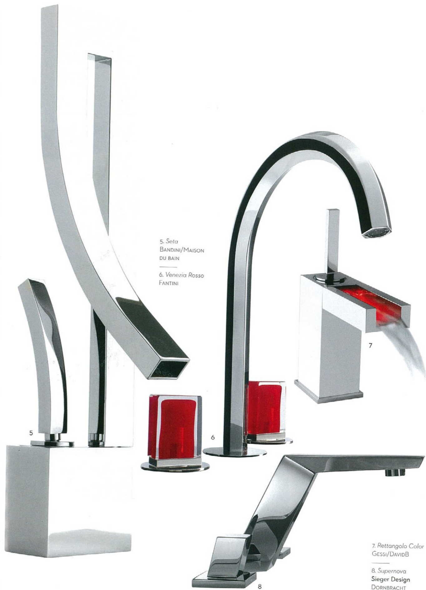
5. Seta BANDINI/MAISON DU BAIN 6. Venezia Rosso FANTINI