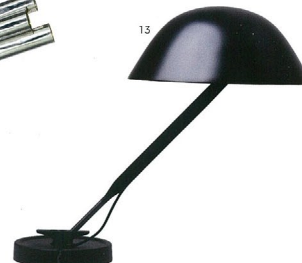
13. Sempé w103 Inga Sempé WÄSTBERG