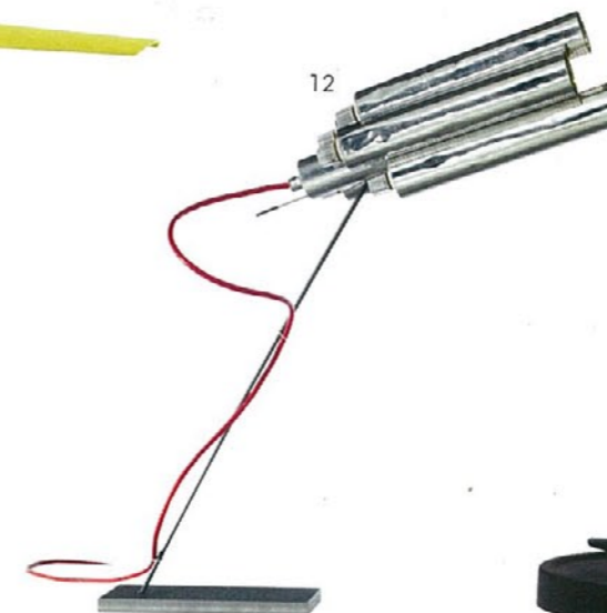
12. Tu-Be Two Ron Arad INGO MAURER