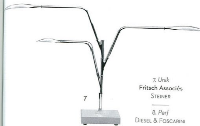
7. Unik Fritsch Associés STEINER 8. Perf DIESEL & FOSCARINI