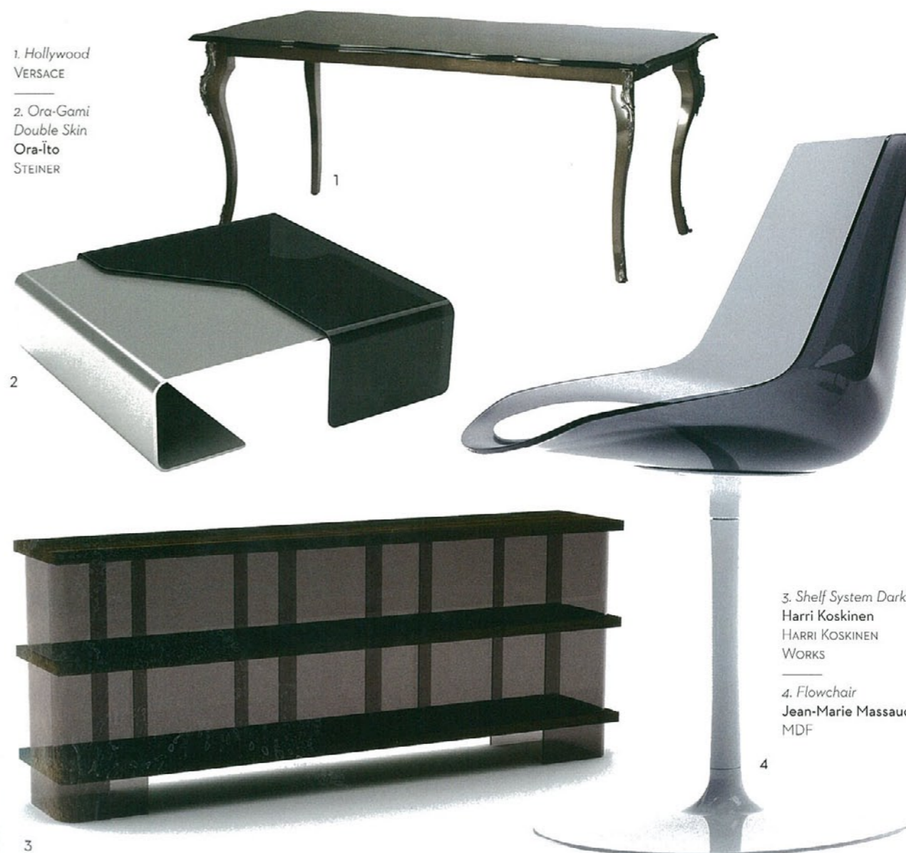
3. Shelf System Dark Harri Koskinen HARRI KOSKINEN WORKS